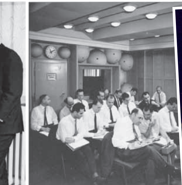
1966 - Fachgruppe des OIRT im RFZ-Abhörraum